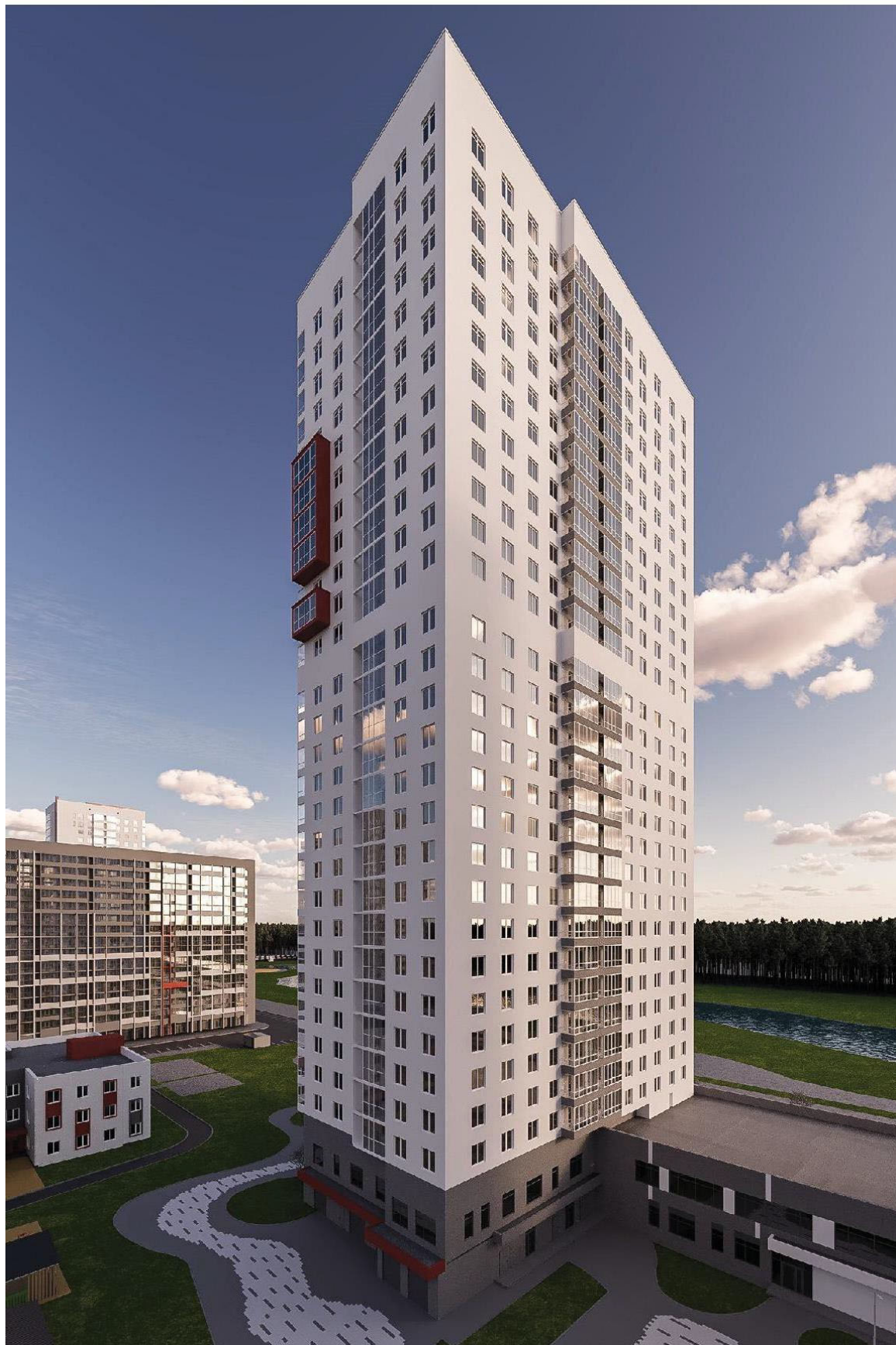
Рис. 1. Фасад в осях 1-15