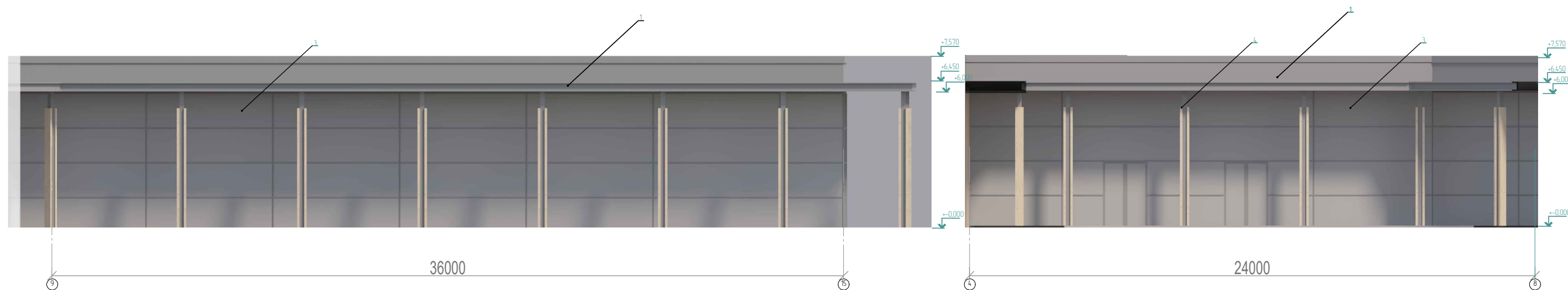
Ведомость отделки чертежей