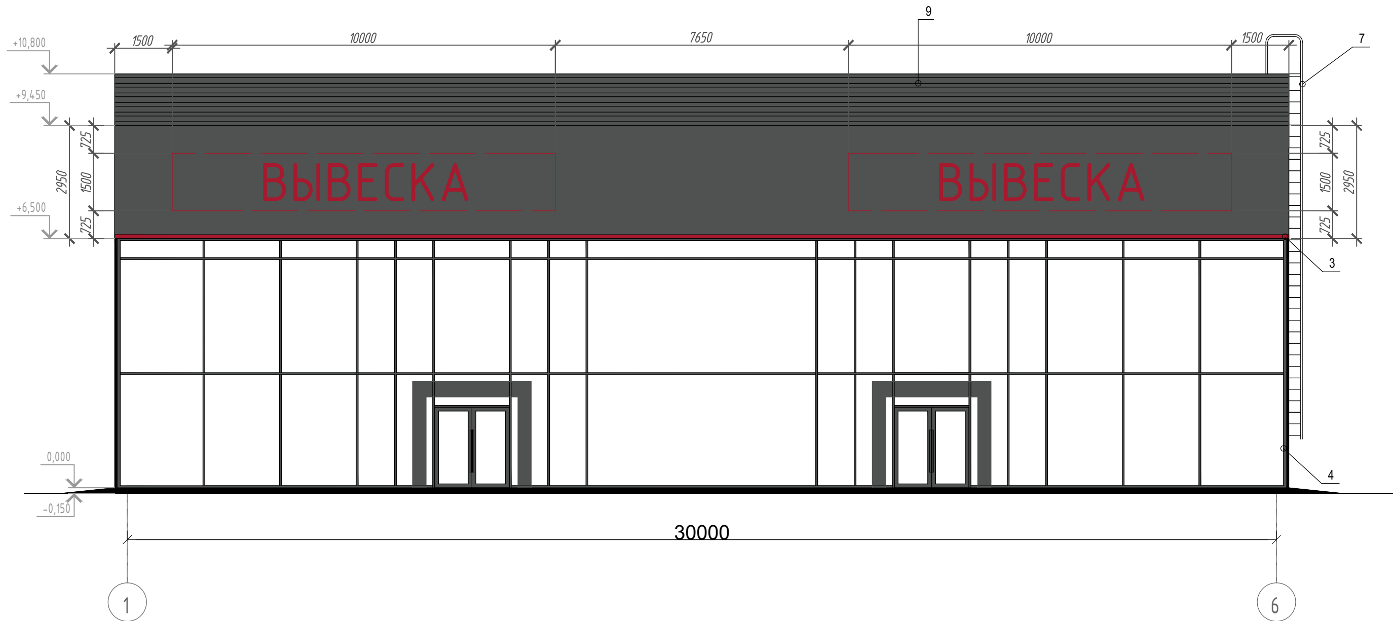
ВЕДОМОСТЬ ОТДЕЛКИ ФАСАДА